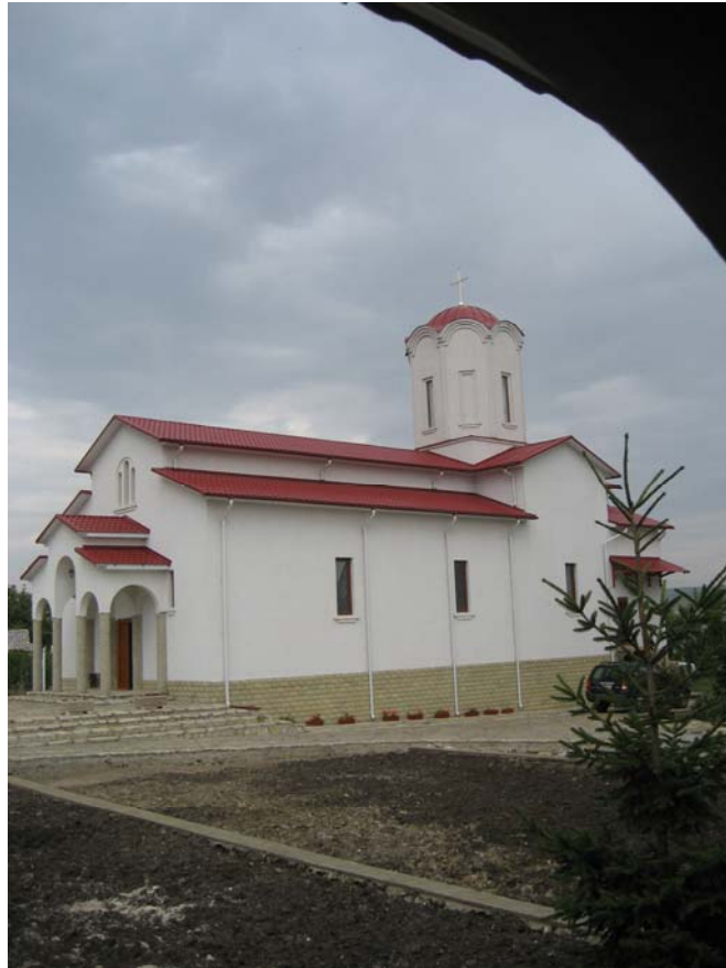
Biserica Bunavestire și Sf. Ioan Iacob Hozevitul