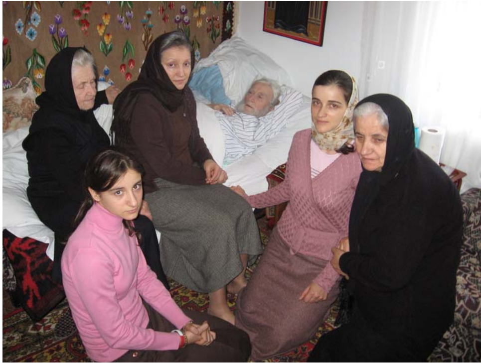
Copii duhovnicești ai părintelui Mihail de la București

Cu o săptămână înainte de trecerea la cereștile locașuri i-a chemat pe toți cei dragi pentru a-și lua ultimul rămas bun, rugându-i să-i continue lucrarea începută, asigurându-i că dacă va afla trecere la Domnul tot timpul se va ruga pentru dâșii.