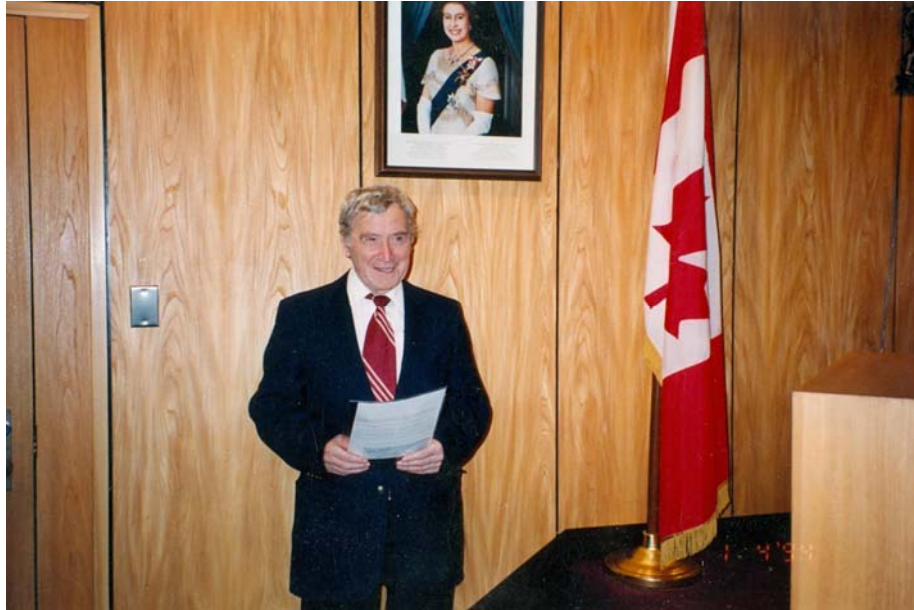
Pr Mihail la primirea cetățeniei canadiene